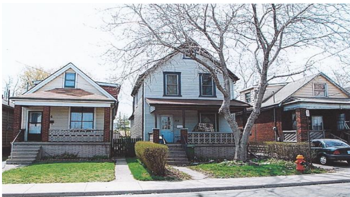
Het gezin woont op Whitfield Avenue nr. 42 te Hamilton Ontario (het middelste huis)